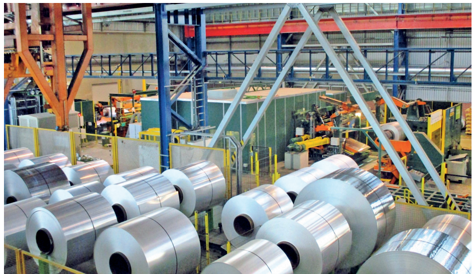
Abb. 2: Ansicht der Längsteilanlage Nr. 4 mit Automatik-Coillager

Die Aluminiumbänder sind auf Hülsen gewickelt und lagern im vollautomatischen Bundlager (Abb. 2), das sich im angrenzenden Hallenschiff befindet. Sie werden mittels Kran zum Bundhubwagen transportiert, der das Coil dann auf den Abhaspeldorn aufgibt oder auf einen der beiden weiteren Ablageplätze des Bundmagazins ablegt.