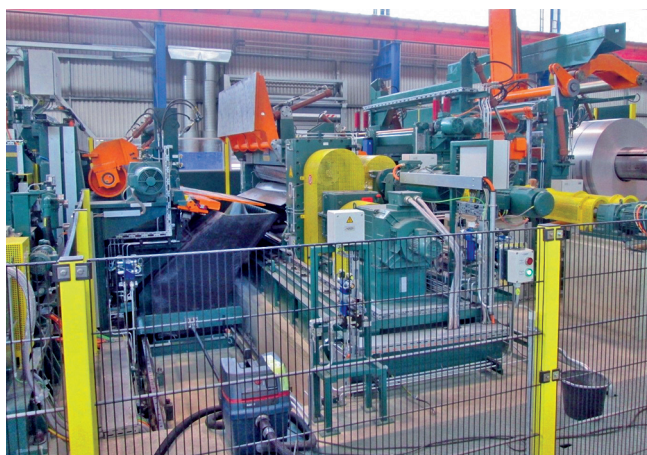
Abb. 5: Trommelschere

After the start of the strip has passed over the deflection roll unit, the inspection table is extended and there a visual inspection of the strip can be carried out with the help of large mirrors. The underside of the strip can be seen without obstruction with the help of the lower mirror when it passes beyond the inspection table. The lower mirror is mounted on a hand-operated wagon.