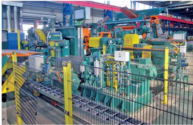
Abb. 3: Einlaufbereich

Der anfallende Besäumschrott wird mittels einer Saumstreifenschrottschere in kurze Streifen geschnitten, die über ein darunter befindliches Transportband zu Schrottkübeln neben der Anlage transportiert werden. Die Saumstreifenoptimierung nutzt die in Echtzeit